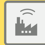
ГУДКИ ПРЕДПРИЯТИЙ И ТРАНСПОРТНЫХ СРЕДСТВ