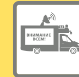
ПОДВИЖНЫЕ ЗВУКОУСИЛИТЕЛЬНЫЕ УСТАНОВКИ